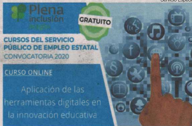
► Cartel del curso sobre herramientas digitales en la educación.

El alumnado aprenderá a utilizar los ordenadores y las aplicacio-