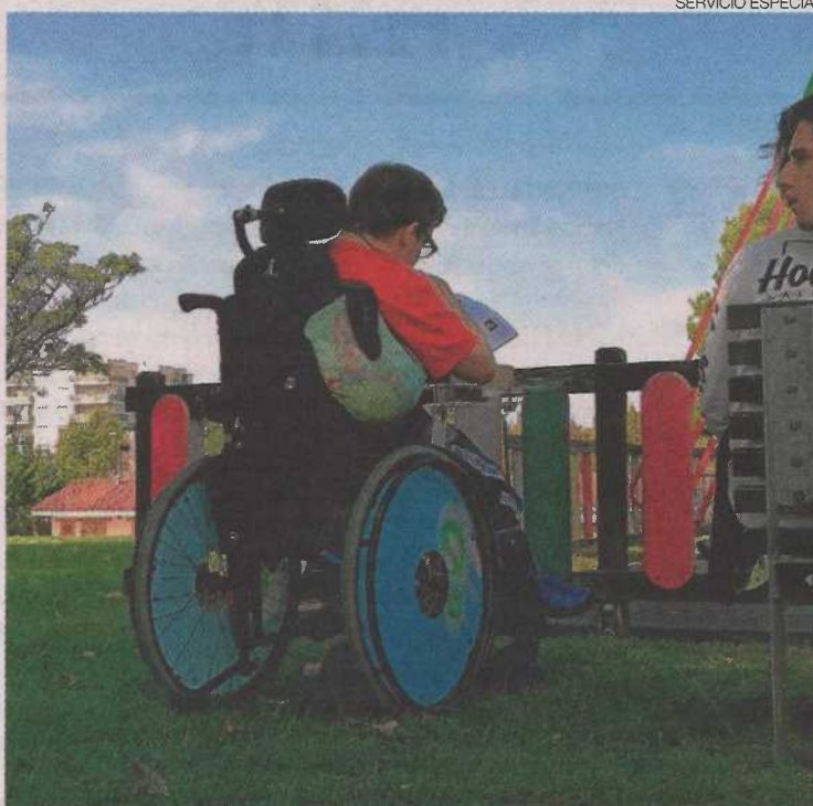
▶▶ Plena inclusión intenta que las personas con discapacidad intelectual puedan acceder al inminente ingreso mínimo vital.

Precisamente, por esta vulnerabilidad derivada de la relación entre pobreza y dis-