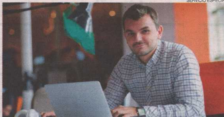
▶▶ Consejos para una videoentrevista.

En primer lugar, prepárate con anterioridad. Busca información sobre la empresa, piensa las posibles preguntas que te puedan realizar y busca las